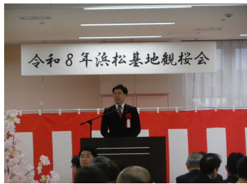
令和8年浜松基地観桜会

近の緊迫する厳しい安全保障環境について言及がありました。話題もありました。今年の隊員の入隊状況は浜松市の他、近隣の湖西市、磐田市、袋井市、掛川市といずれの市でも昨年の入隊者数を上回ったとの紹介がありました。これも処遇改善の