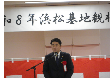
令和8年浜松基地観桜会

観桜会では主催者の浜松基地司令の満開宣言で始まり、浜松防衛団体連合会会長の挨拶、国会議員及び浜松市長の祝辞が述べられた後、鏡開きが行われ、隊友会新