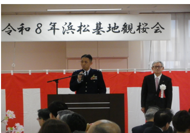
令和8年浜松基地観桜会

23.8℃と4月下旬頃の陽気となり、2分咲きの桜が楽しめます。今年はどうかと天候は快晴、気温は18時時点で16℃と外で花見を楽しむには少し寒い程度、屋内では丁度いい加減でした。基地内の桜も美しく咲き誇り、特に旧電子戦講堂の前の通