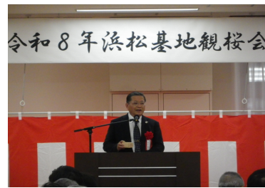
令和8年浜松基地観桜会