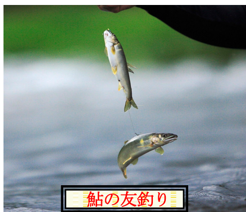
出展「Honda釣りクラブサイト」

ゆったりと流れる浅い瀬には、ほ どよい石が点在しています。 オトリがうまく泳いでくると、 目印が飛ぶ強いあたりが見られる。