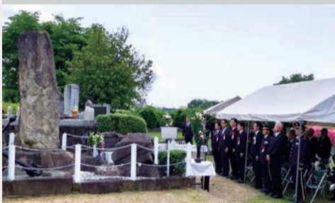
参列者の国歌斉唱