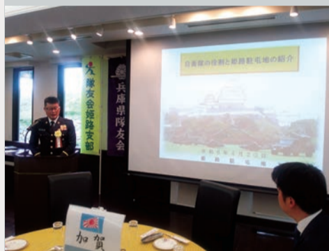
姫路駐屯地司令の記念講話