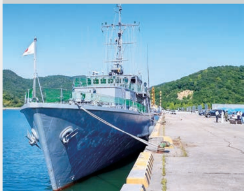
掃海艇あおしまの勇姿