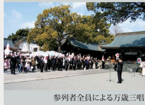
参列者全員による万歳三唱