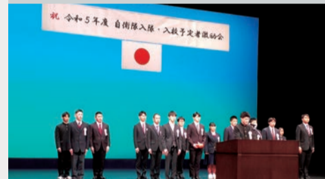
代表者の力強い挨拶