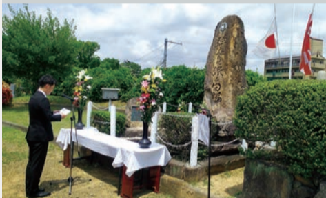
来賓代表の追悼の辞