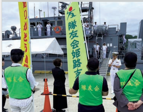
第42掃海隊司令の入港歓迎挨拶