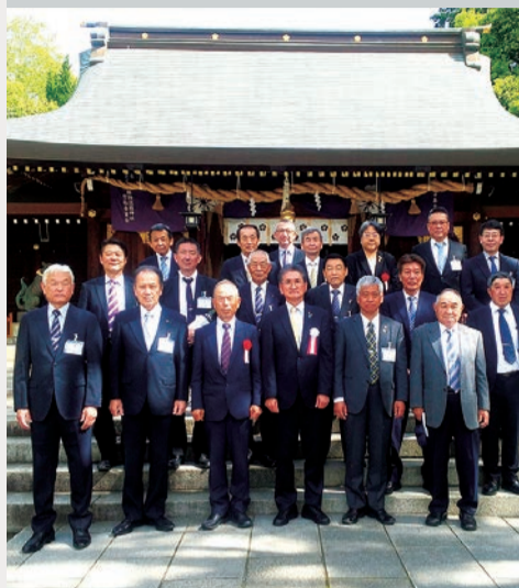
総会前参拝時の集合写真