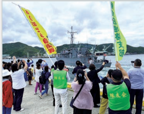
相生市民と共に出港見送り