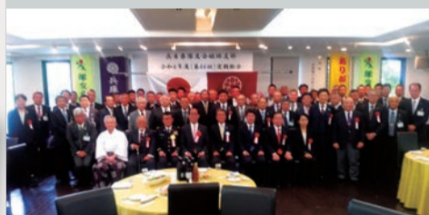
出席者全員で記念撮影