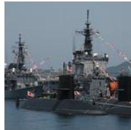
アレイからすこじま(1)

江田島市は、平成16年、近隣4町が合併した、人口約23,000人、約100km 2 の市です。明治21年に海軍兵学校が移転して以来、「海軍の島」として全国に知られるようになりました。現在は、旧兵学校の建物が海上自衛隊の教育機関として現役で使用されているなど、海上自衛隊の施設が複数存在しているのが特徴です。