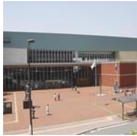
大和ミュージアム(1)