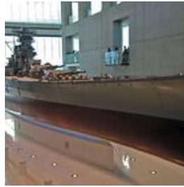
大和ミュージアム(1)