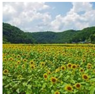
君田のひまわり畑(1)