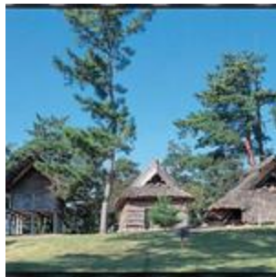
みよし風土記の丘(1)