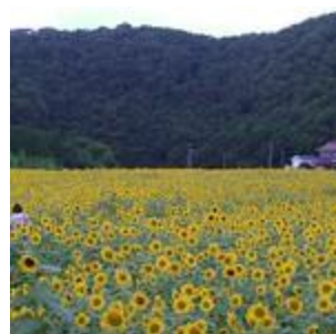
君田のひまわり畑2(1)