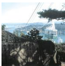
千光寺ロープウェイ(1)