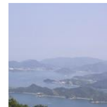
筆影山からの景色(1)