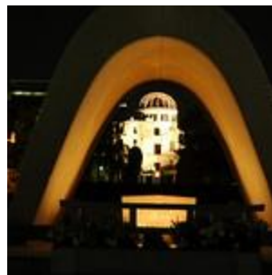
慰霊碑からの原爆ドーム(1)