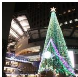
パセーラ クリスマスツリー(1)