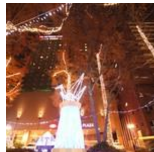
ドリミネーション(1)