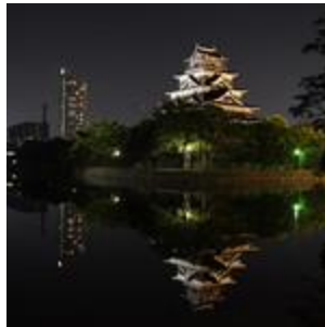
広島城 ライトアップ(1)