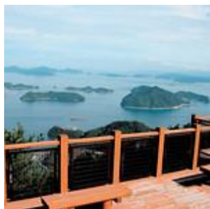
神峰山頂からの景色(1)

大崎上島町 は、造船業と、みかん・レモンなどの柑橘類やブルーベリーの栽培が盛んな離島です。海では、シーカヤック体験や伝統行事「権伝馬競漕」、山では、神峰山頂から眺める大小の島々が織りなす美しい風景など、瀬戸内海ならではの島です。