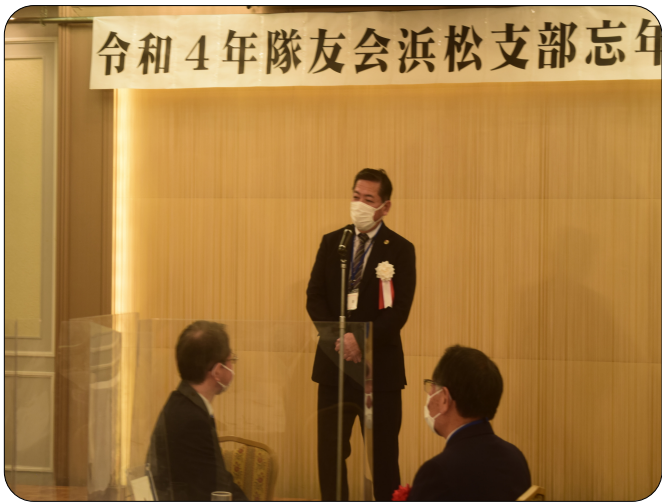
令和4年隊友会浜松支部忘年会