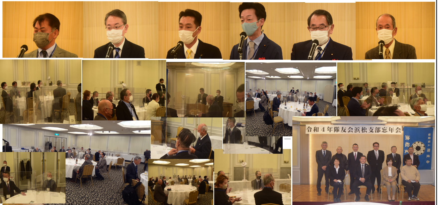
令和4年隊友会浜松支部忘年会

浜松支部は浜松基地司令のご厚意により隊友会会員の皆様を対象として浜松基地見学ツアーを行います。基地施設や装備品をはじめ変わりつつある航空自衛隊や基地の姿をご覧頂きたいと思っております。時期等については次号でご案内します。