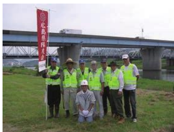
クリーン太田川参加