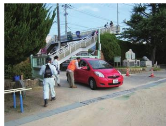
8.20土砂災害ボランティア