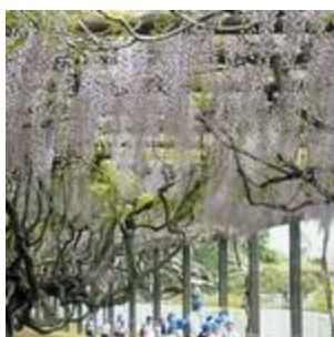
三永水源池の藤棚(1)