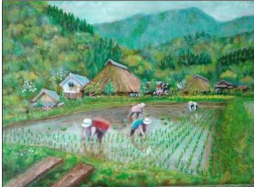
絵：北澤 好男 隊友

1階ロビー喫茶店にて「ギャラリーの絵を見に来た。」旨を告げて頂ければコーヒーが無料になります。