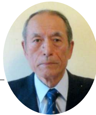
静岡県隊友会会長