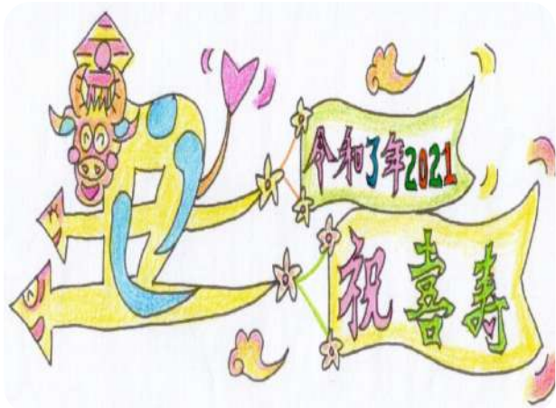
絵: 小原 豊 隊友

これからも健康に留意しつつ、多くの皆さんと共にここ浜松で充実した日々を過ごしていきたいものと感じています。