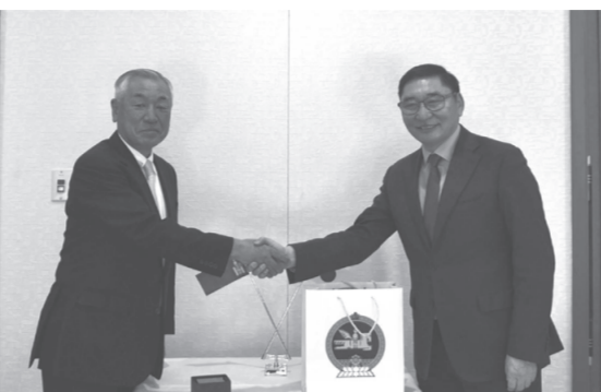
トーゴ事務総長と親善の握手を交わす折木理事長