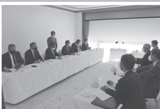
親善会合(グランドヒル市ヶ谷)

普遍的価値を共有する重要なパートナーであり、陸軍及び空軍レベルの能力支援事業を通じた防衛交流を進められており、現役を支える立場として、関係を深めることは重要である」との歓迎挨拶で、総長からは、モンゴル軍