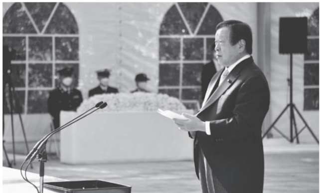
追悼の辞を述べる浜田防衛大臣

国歌清聴に続き、新たに昨年7月1日から今年8月31日までの間に公務で亡くなった35隊員の名前が読み上げられた後、浜田大臣が35柱の名簿を奉納。陸自302保安警務中隊による特別儀仗隊