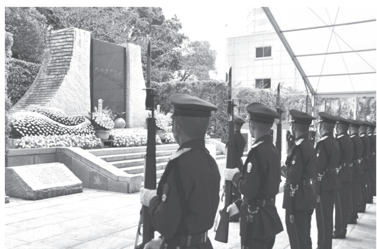
英霊に捧げる花束を行う陸自302保安警務中隊