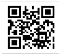
県隊友会のお知らせ

最近ではスマートフォンを使われる方が多く、スマートフォンから県隊友会のお知らせやフェイスブックを見るのにQRコードを掲載してほしいとの要望がありましたので、掲載しました。ご活用下さい。