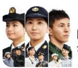
国家を守る、公務員。

社会活動等についても話題を広げてみようと思う。 【提言】 本紙読者(OB)で、再就職での「失敗談や成功談、苦労話やアドバイス」等を気ままに投稿してみませんか。退官予定者等への職業選択のヒントになるかもしれません。 OBの貴重な体験