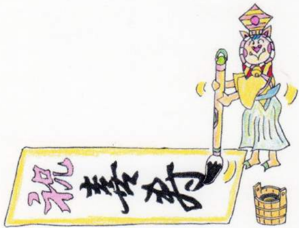
絵:小原 豊 隊友

する基地を目的の当たり前に共に生活させていたに共々です。早いもので、退官後22年シブリアンとして3箇所勤務しましたがあつという間に後期高齢者あつという間に喜寿のお祝い...涙です。残りの人生を意義のある余生をと思えばかりです。