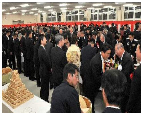
浜松支部で賀詞交歓会が開催

1月15日(火)、 浜松基地隊員食堂 において招待者等 約五百人が出席す る中、盛大に賀詞 交歓会が開催され た。