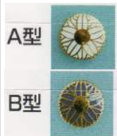
A、B型は色違いで同価格の1,000円

浜松支部では行事等の活動の場において会員記章の着用を行っていただきます。ご希望の方は会計担当またはお近くの役員等にお申し出下さい。